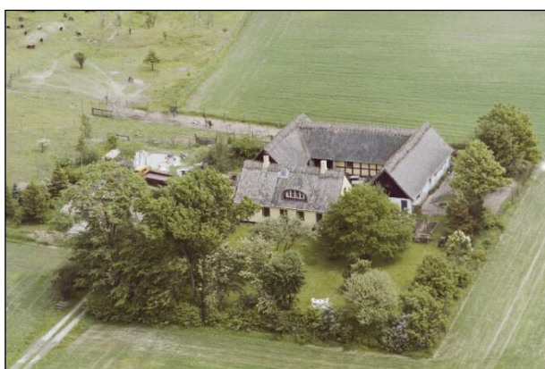
Hørsænkegaard - Luftfoto 1987