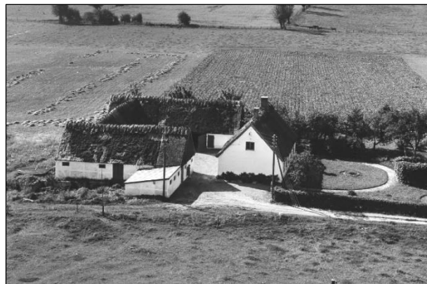
Hørsænkegaard - Luftfoto 1961