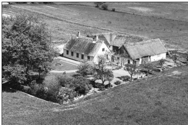
Hørsænkegaard - Luftfoto 1955

Luffotos fra ' Danmark set fra Luften ' (Det Kongelige Bibliotek):