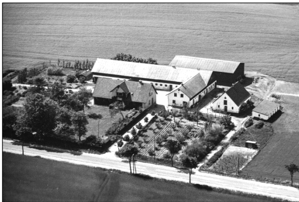
Frederiksgave - Luftfoto 1949

Luftfotos fra ' Danmark set fra Luften ' (Det Kongelige Bibliotek):