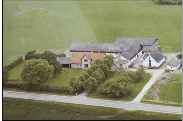
Frederiksgave - Luftfoto 1987