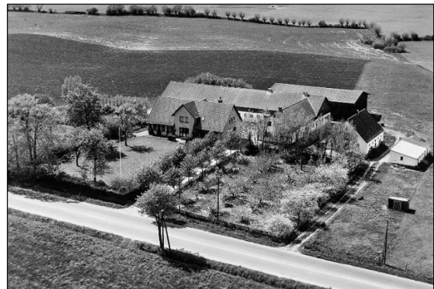
Frederiksgave - Luftfoto 1955