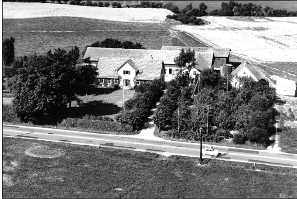
Frederiksgave - Luftfoto 1961