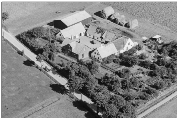
Gammelsøgaard - Luffoto 1939

Luffotos fra 'Danmark set fra Luften' (Det Kongelige Bibliotek):