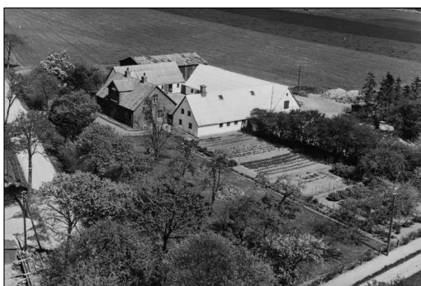
Gammelsøgaard - Luffoto 1955