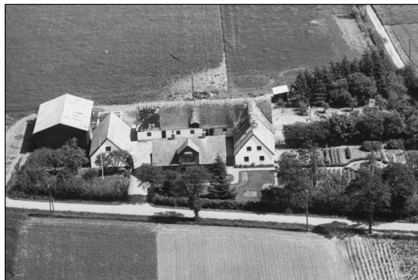
Gammelsøgaard - Luffoto 1949