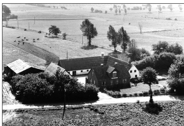
Gammelsøgaard - Luffoto 1961