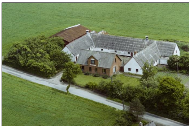
Gammelsøgaard - Luffoto 1987